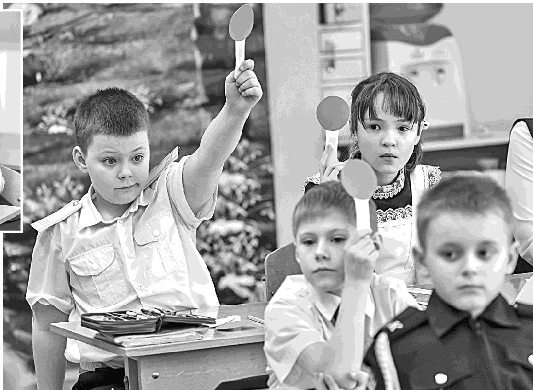
Использование техники «Светофор» в начальной школе

Задания разные: схемы, вопросы (в том числе в формате «допиши фразу или предложение») и даже ребусы. Выполнить их ребята должны за определённое