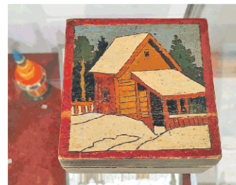
Штукунка-коробочка «Зима в деревне» (1930-е гг.)