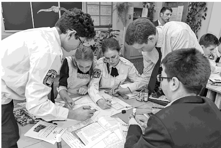
Заполнение ментальной карты