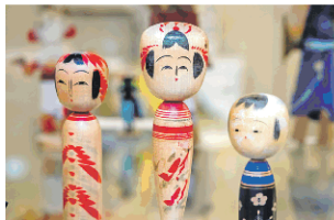
Японские куклы кокэси