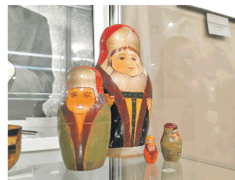
Набор матрёшек «Боярыни» (1910-е гг.)