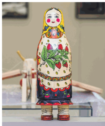
Матрёшка на ножках

А ещё на выставке вы увидите своеобразную «японскую матрёшкуню» — кокэси, характерная особенность которой — цилиндрическое тело с прикреплённой головой и отсутствием рук и ног. Эти куклы, покрытые росписью, появились в Японии ещё в XVII веке и до сих пор пользуются огромной популярностью у японцев самого разного возраста. Любопытно, что заготовки для этой куклы делают в России!