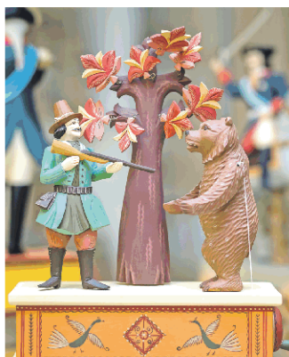
Деревянная игрушка «Охотник и медведь» мастера Ольги Михайловой