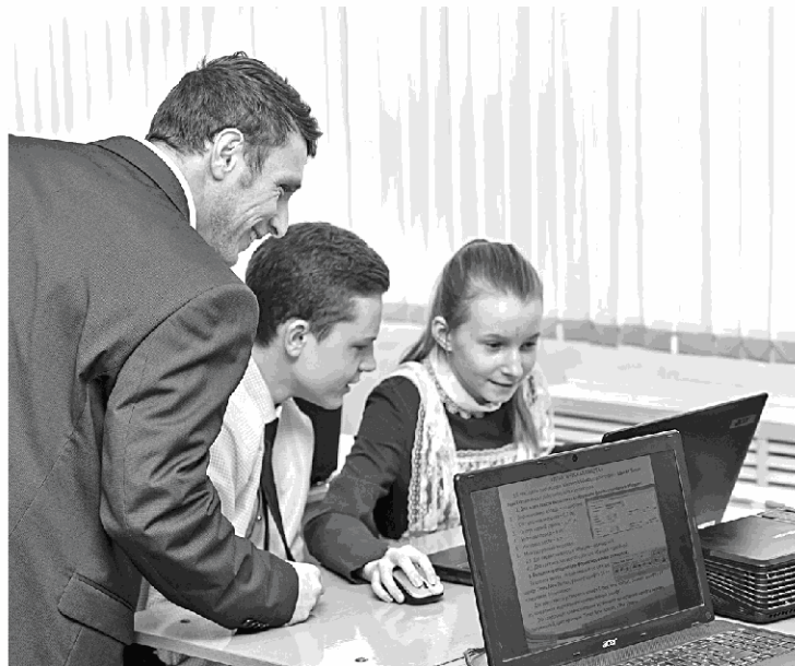
Ребята выполняют практическое задание на компьютере

Учитель раздаёт ребятам карточки с вопросами: «Чему я научился за эту неделю?», «Какие вопросы для меня остались неясными?», «Какие вопросы