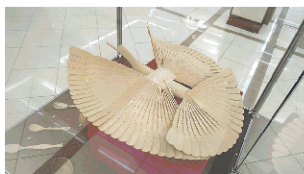
Архангельская щепная птица