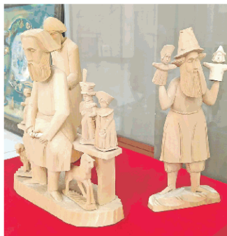
«Резчик-игрушечник» и «Купольник» мастера Ярослава Аршинова